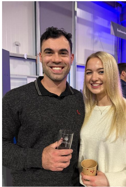
Weihnachtsfeier bei BEWA solutions