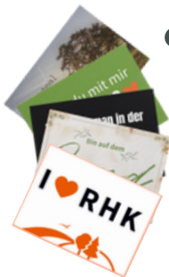
3 Postkarten (DIN A6, Motiv je nach Verfügbarkeit)