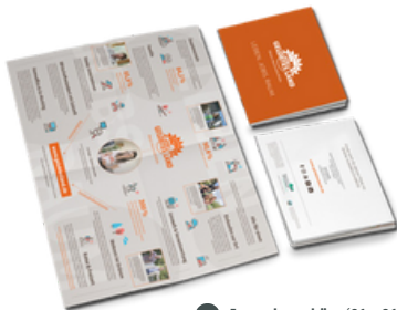
1 Imagebroschüre (21 x 21 cm)