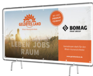
2 Outdoor-Banner z. B. für Zäune (145 x 110 cm, 250 x 150 cm oder 340 x 173 cm)