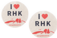
7 Aufkleber I like RHK