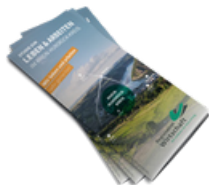
5 Flyer Erwerbstätigenbefragung (DIN lang)